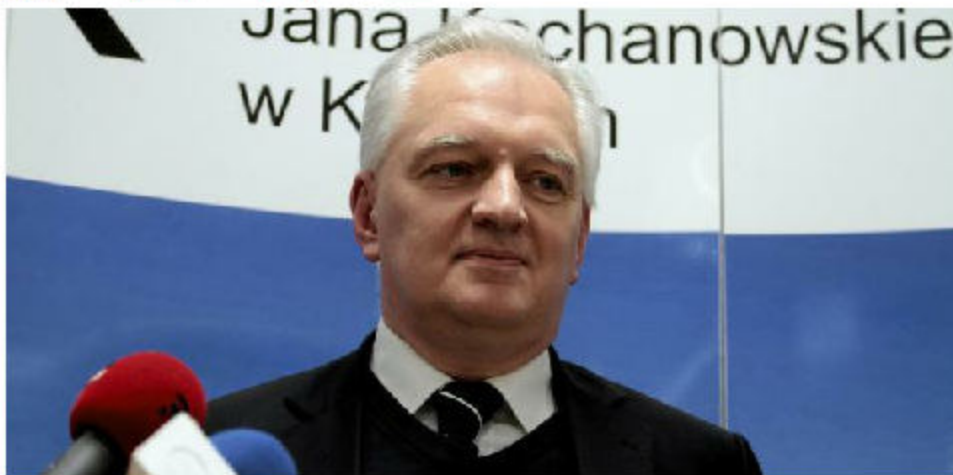
Gowin: Wzrost gospodarczy należy uzależniać od zasobów polskiej nauki